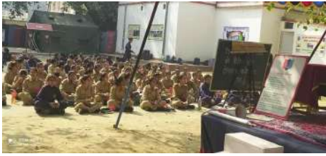
सीएटीसी कैंप वाराणसी