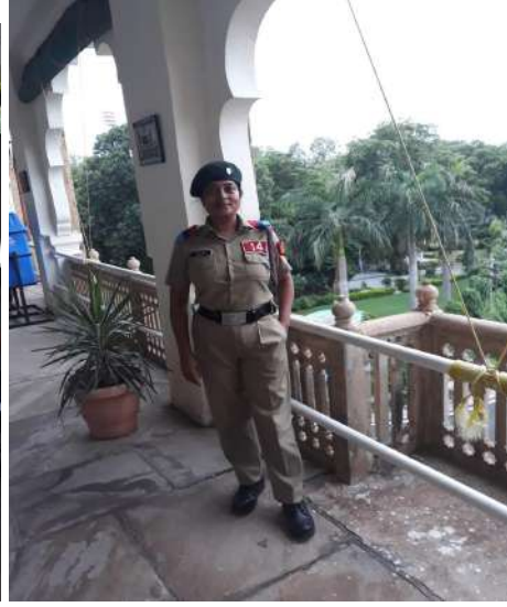
ऑफिसर ट्रेनिंग अकैडमी ग्वालियर में प्रशिक्षण के दौरान।