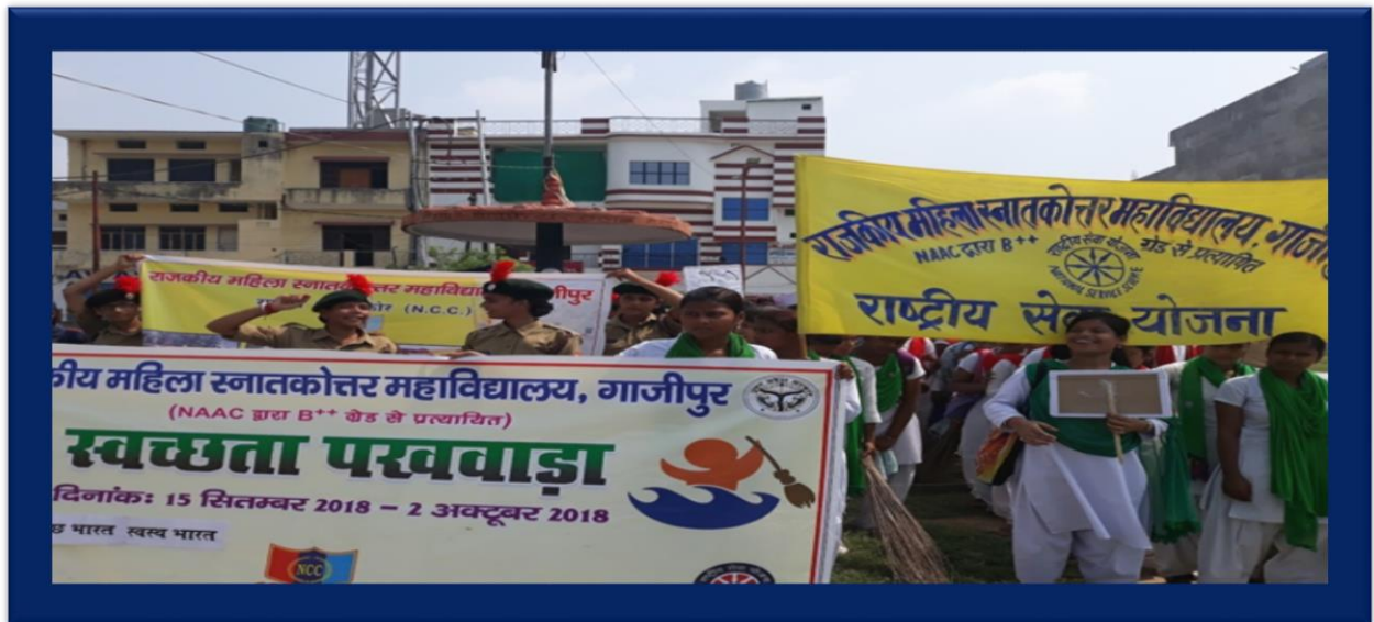
Cleanliness Camp by NCC cadets in the college campus.

NCC cadets marching out for Swachta Pakhwada to create awareness regarding cleanliness among citizens.