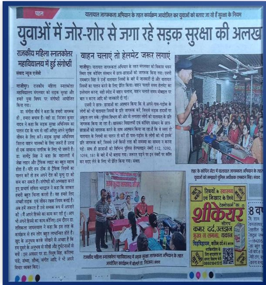
Teachers and students taking traffic oath under the Road Safety Month Celebration

A seminar was organized on the theme titled “Road safety & our youth” in the college to create awareness among youths regarding the road safety.